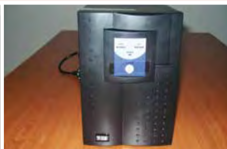
UPS: 25.000 ECV