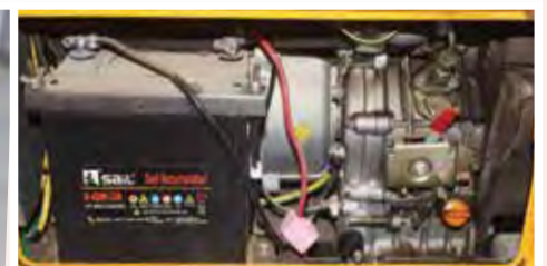
Gerador Aslo Silencioso 5 KVA: 85.000,00 ECV