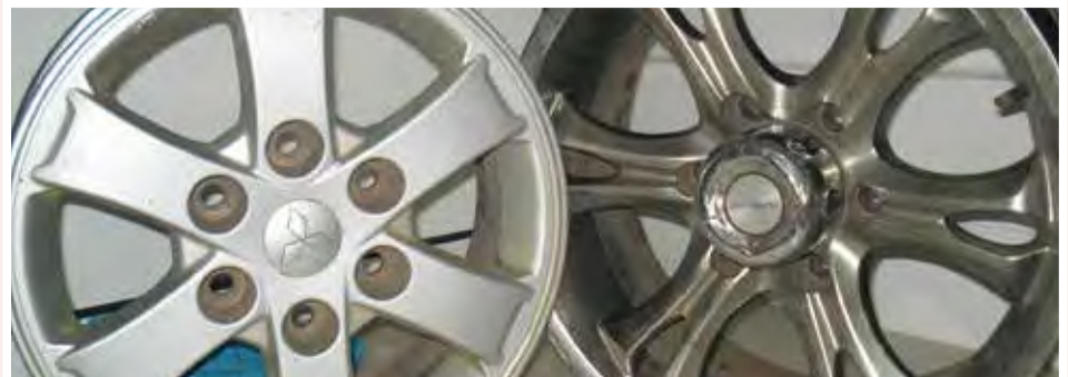
Jantes: 5.000 ECV unidade