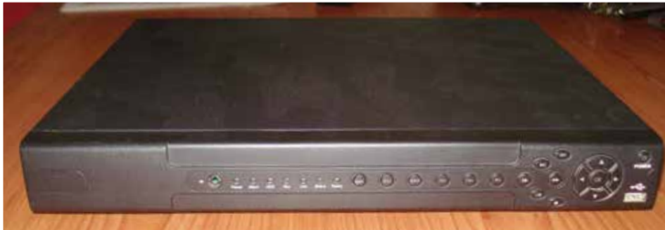
Sistema completo de video vigilância, com 16 câmeras IP: 75.000,00- ECV