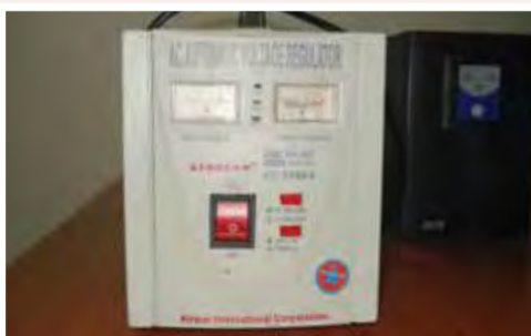
UPS: 25.000 ECV