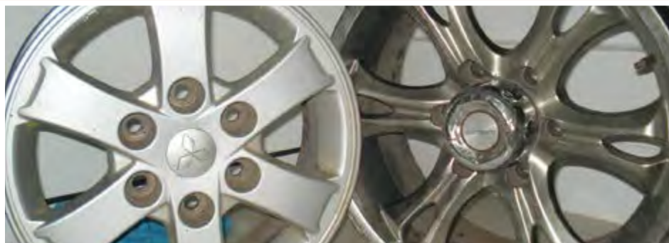
Jantes: 5.000 ECV unidade