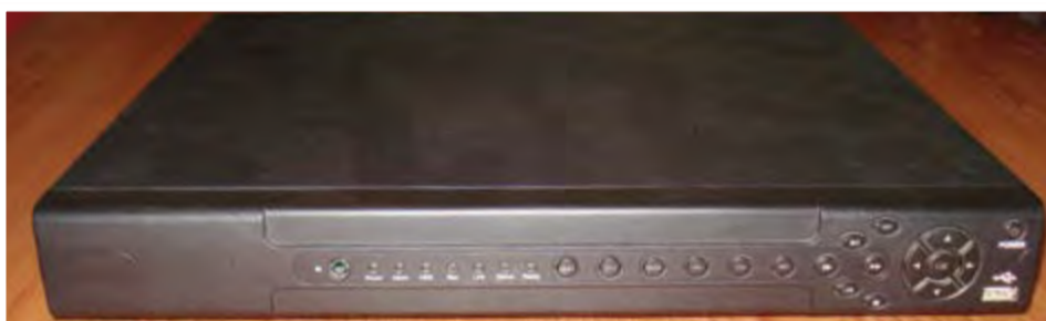
Sistema completo de video vigilância, com 16 câmeras IP: 75.000,00- ECV