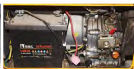
Gerador Aslo Silencioso 5 KVA: 85.000,00 ECV