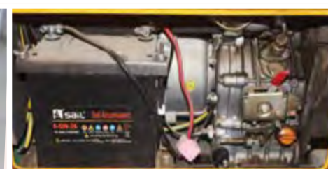
Gerador Aslo Silencioso 5 KVA: 85.000,00 ECV