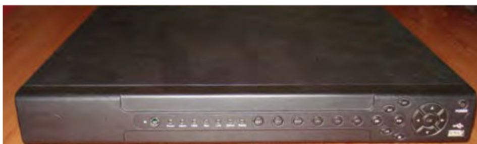
Sistema completo de video vigilância, com 16 câmeras IP: 75.000,00- ECV