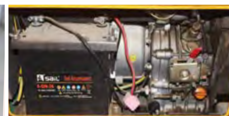
Gerador Aslo Silencioso 5 KVA: 85.000,00 ECV