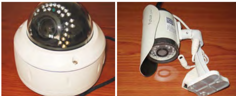
Sistema completo de video vigilância, com 16 câmeras IP: 75.000,00- ECV