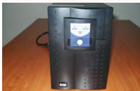
UPS: 25.000 ECV