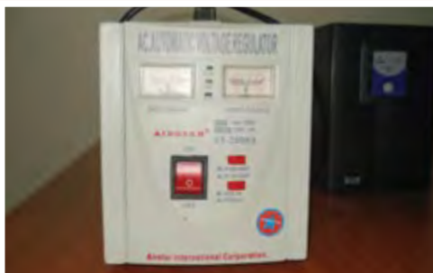
UPS: 25.000 ECV