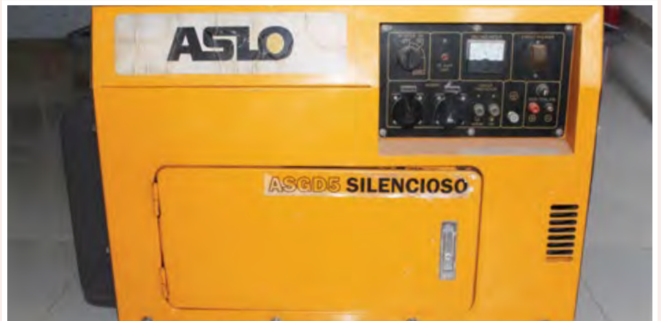
Gerador Aslo Silencioso 5 KVA: 85.000,00 ECV