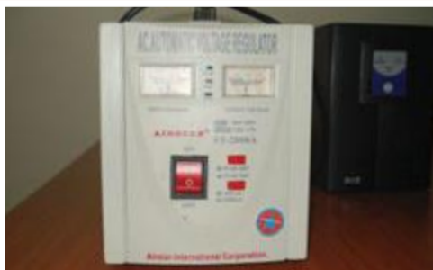
UPS: 25.000 ECV