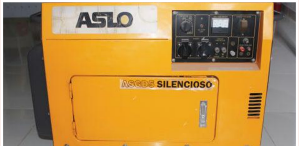
Gerador Aslo Silencioso 5 KVA: 85.000,00 ECV