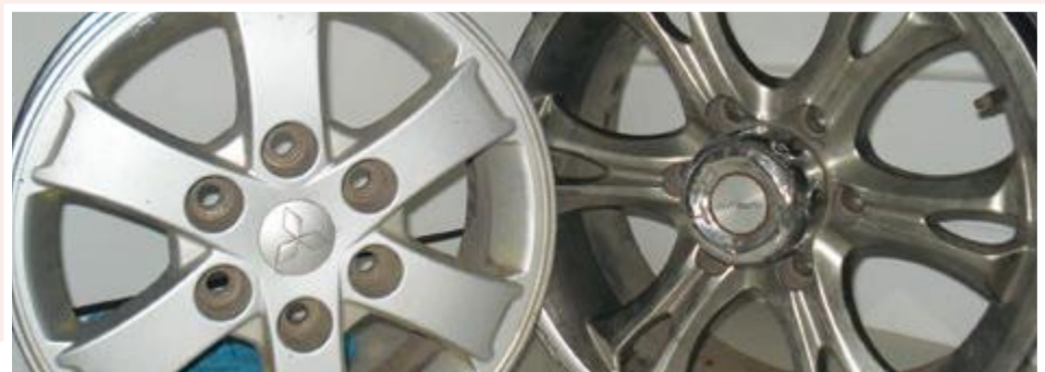
Jantes: 5.000 ECV unidade