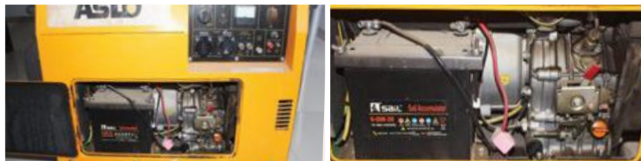
Gerador Aslo Silencioso 5 KVA: 85.000,00 ECV