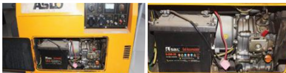
Gerador Aslo Silencioso 5 KVA: 85.000,00 ECV