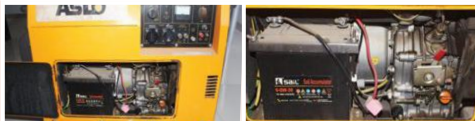
Gerador Aslo Silencioso 5 KVA: 85.000,00 ECV