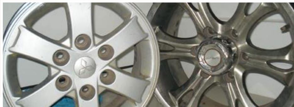
Jantes: 5.000 ECV unidade