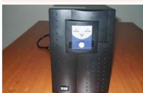
UPS: 25.000 ECV