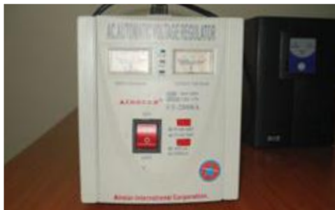
UPS: 25.000 ECV