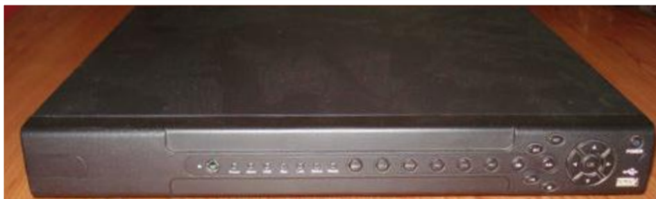
Sistema completo de video vigilância, com 16 câmeras IP: 75.000,00- ECV