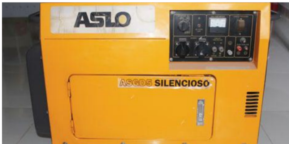
Gerador Aslo Silencioso 5 KVA: 85.000,00 ECV