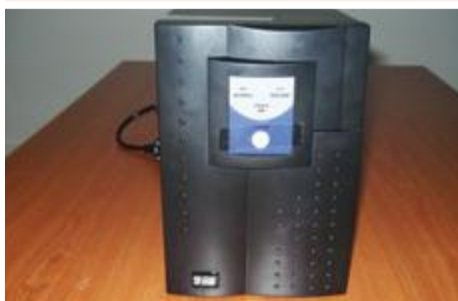
UPS: 25.000 ECV