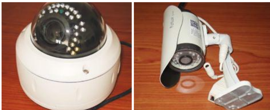
Sistema completo de video vigilância, com 16 câmeras IP: 75.000,00- ECV